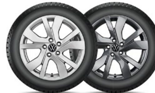
VW Rockingham Silber

VW Huntsville Silber für den neuen Tiguan in 19" mit 235/50 R19 103V XL Bridgestone Blizzak LM005 statt 3.600,- mit TopCard 2.700,- KE: C | NHK: A | GE: 72 | GE/G: B | SK-F: Nein Art.-Nr. 2355019HV40005